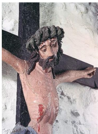
La statue de Somal

Mais qui est cet artiste ? Assez curieusement, son identité est inconnue mais l'intégralité des œuvres est consacrée à des thèmes religieux. La grande partie de celles-ci sont réparties dans la Famenne et y constitue le joyau de l'art religieux . Les spécialistes s'accordent à dire qu'elles ont des similitudes avec des réalisations d'un sculpteur de Dinant, au service du Prince Evêque de Liège. Vraisemblablement, le maître était installé à Marche durant la première moitié du 16 ème siècle, où il dirigeait certainement un atelier. Son style, très clairement gothique , a été influencé lors de la création de ses dernières œuvres par celui de la Renaissance.