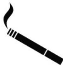
Un mégot de cigarette 5-12 ans