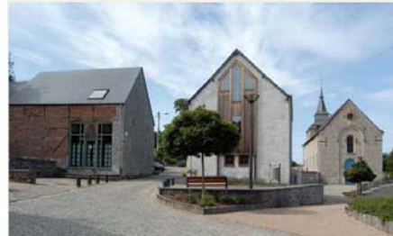
L'aménagement du cœur du village de Heure, un exemple à suivre pour les autres villages

Dans le cadre des opérations de développement rural précédentes, signalons le cœur de village de Heure qui a pu bénéficier d'une complète revitalisation et amélioration du cadre de vie.