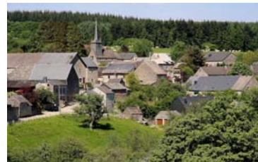
Le village de Chardeneux, un des « Plus Beaux Villages de Wallonie »

Enfin, le Village de Chardeneux, l'un des plus beaux villages de Wallonie, et Bonsin sont soumis au RGBSR.